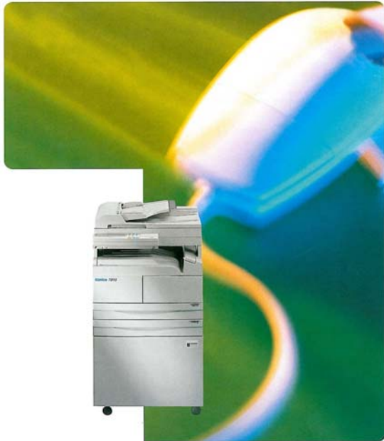
KONICA 7015 DIGITAL DOCUMENT SYSTEM